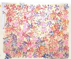
▲ぶどうユニットの みなさまの作品です